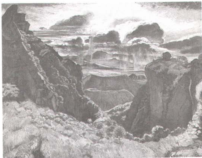
Paisaje de la sierra de Santa Catarina, pintado en 1942 por el Doctor Atl. Ilustración tomada de la revista Saber Ver , núm. 15 El peliclesco doctor Atl . Fundación Cultural Televisa. AC

En conclusión, Santa Martha es una región llena de volcanes que alguna vez estuvieron activos, otros no llegaron a tener actividad, pero ahí están para alegría de nosotros. Al pueblo lo cuidan estos viejos guardianes desde el inicio de los tiempos.