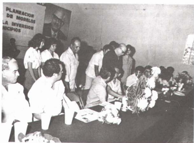
Reunión de planeación de los trabajos municipales, 1979.