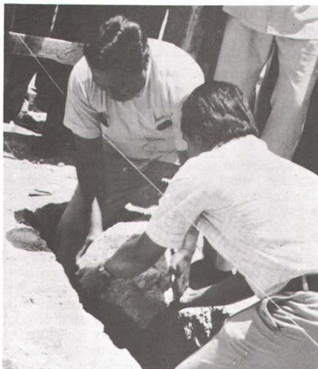
Colocando la primera piedra el 23 de agosto de 1979.