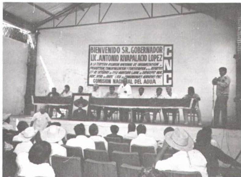
Tercera reunión nacional de organización, producción, comercialización y conservación de los recursos. 27 de octubre de 1992.