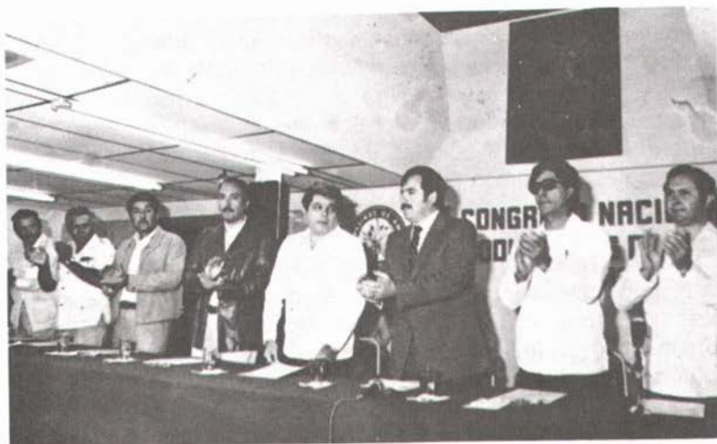
Congreso nacional extraordinario de 22 al 28 de agosto de 1988 de la CNC, México, D. F.