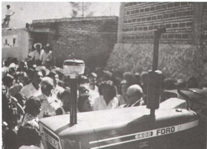
Inaugurando un tractor.