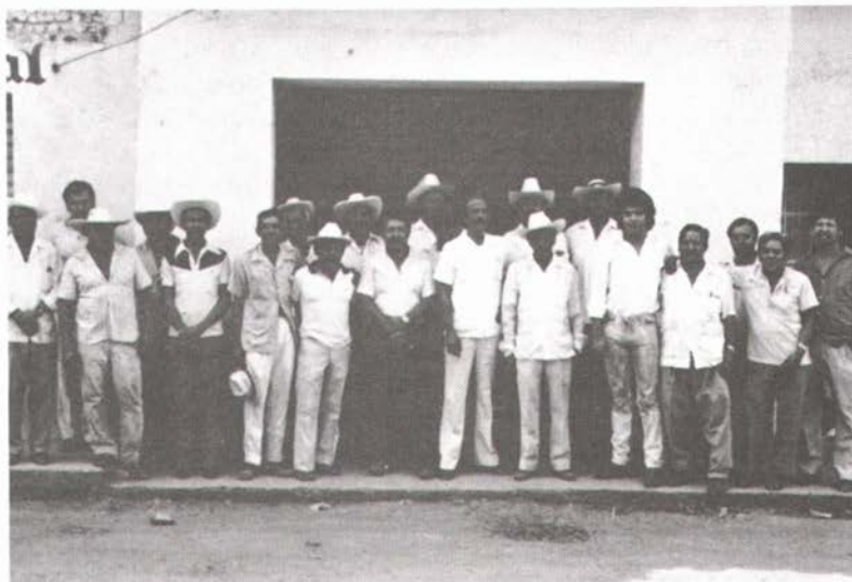
Personas que apoyaron a Lauro el 30 de mayo de 1988.