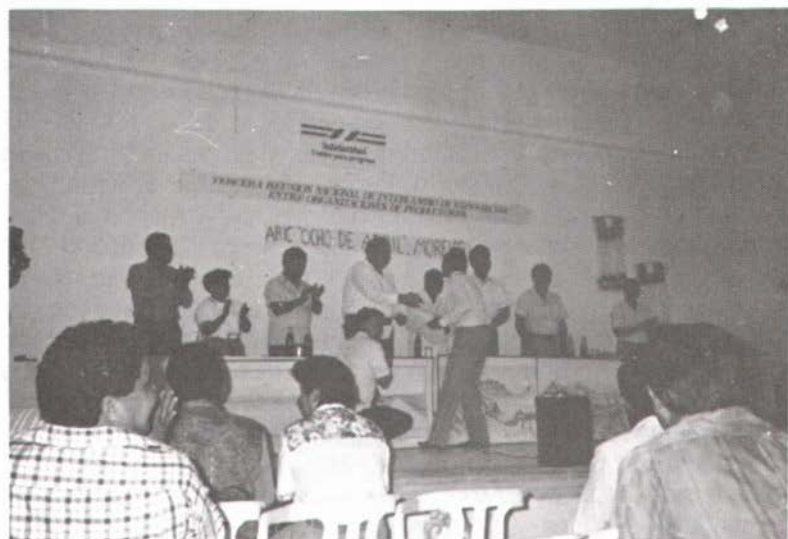
Clausura de la tercera reunión nacional. 27 de octubre de 1992.