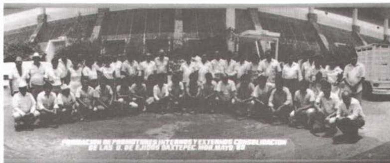
Formación de promotores internos y externos, consolidación de las uniones de ejidos, Oaxtepec, Mor. mayo de 1989.