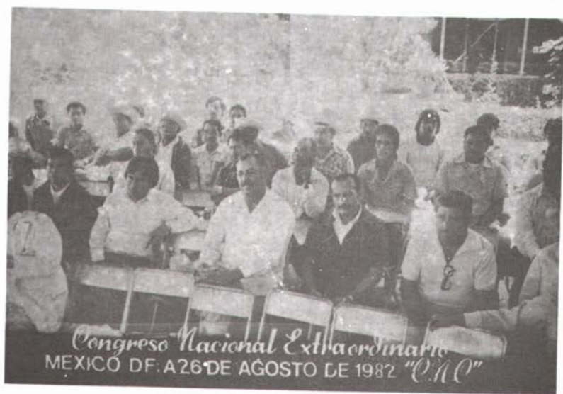
Congreso Nacional Extraordinario en la Ciudad de México, D. F. del 26 al 28 de agosto de 1982.