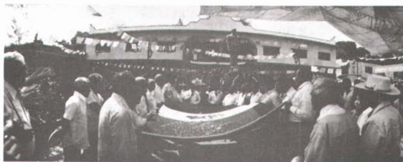
Por primera vez se izó esta bandera en las nuevas oficinas ejidales.