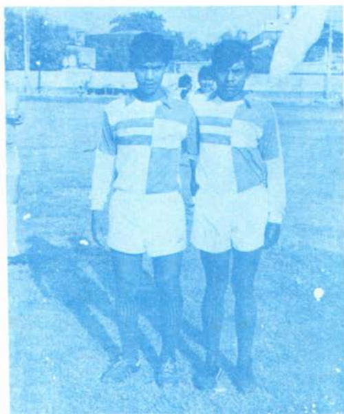
EQUIPOS DE FUTBOL REPRESENTATIVOS DE OACALCO