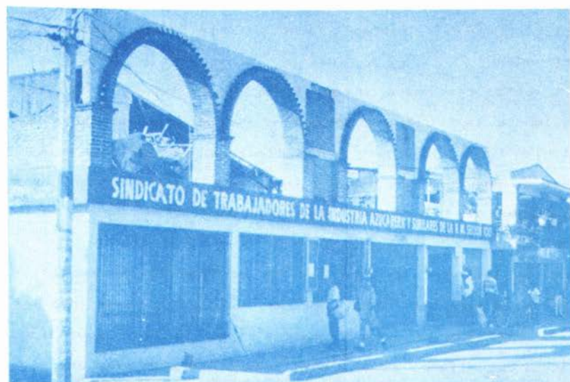
SINDICATO DE LA SECCION 100 DE LA CTM

Como fue de esperarse, finalmente el Sistema Político y Económico Mexicano los arrasó hacia sus "garras", haciéndolos caer en su egoísmo. Finalmente el Ingenio cerró sus puertas y los trabajadores siguieron perteneciendo a la Confederación de Trabajadores de México (CTM).