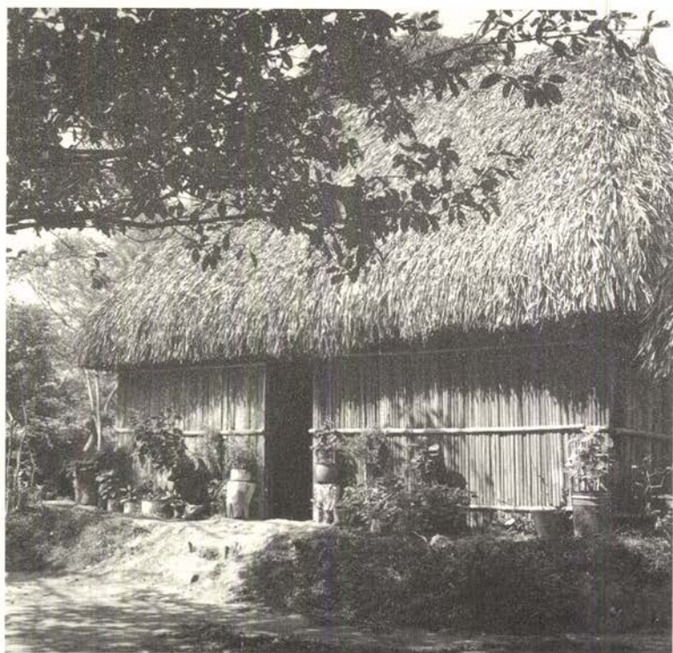
Casa en Boca de San Miguel, Tlacotalpan, Ver.