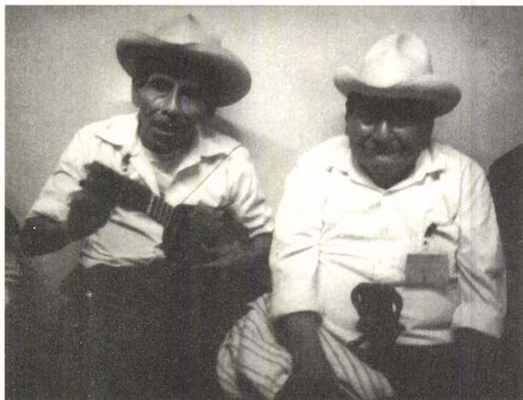
Viejos jaraneros.