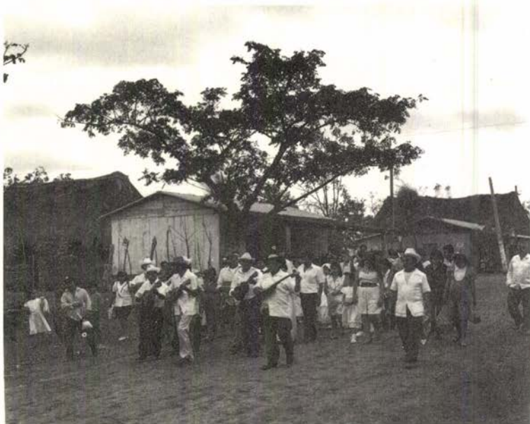
Pascuas y Justicias en San Andrés Tuxtla, Ver.