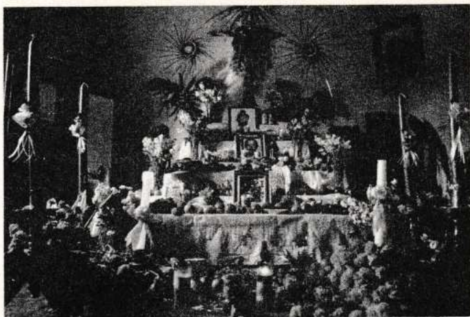
Altar de Muertos en Juchitán.