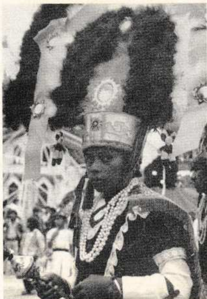
Danzante de La Pluma en la fiesta de Teotitlán del Valle, Tlacolula.