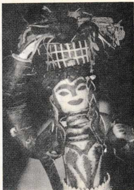
Figura de Noche de Rábanos en la Ciudad de Oaxaca.