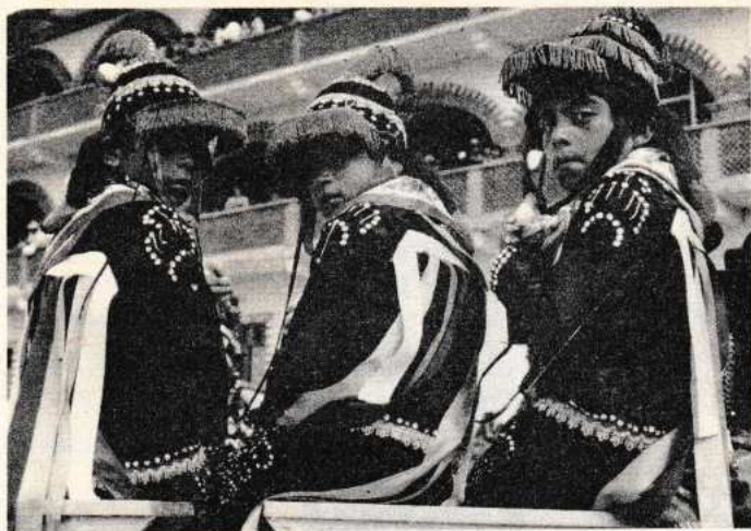
Danzantes de Los Negritos, en San Pedro y San Pablo Ayutla, Mixe.