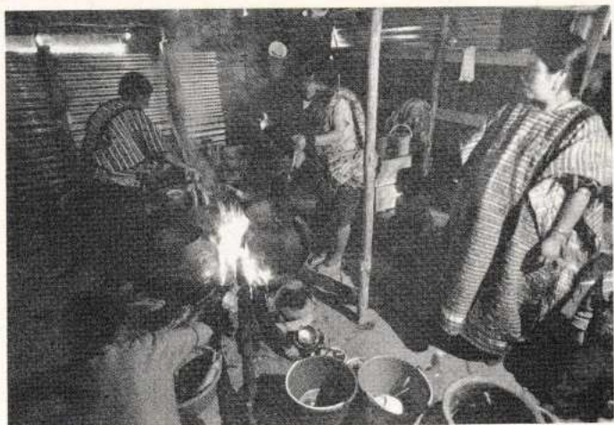
Cocineras de San Andrés Chicahuaxtla, Putla; en una fiesta tradicional.