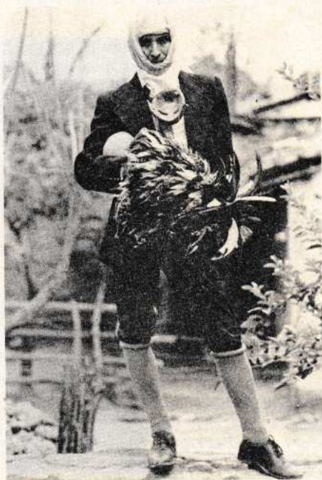
Danzante de Los Tejorones en José María Morelos, Huazolotitlán, Jamiltepec.