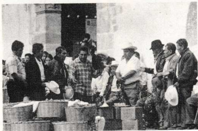
Bendición de alimentos y bebidas en la fiesta titular de Teotitlán del Valle, Tlacolula.