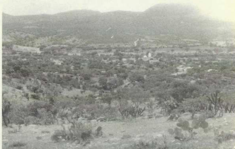
Panorámica de Magdalena Tetaltepec (2001)

Magdalena Tetaltepec, pertenece al municipio de Huajuapán de León, Oaxaca y se encuentra localizado al norte de la Región Mixteca baja, en los límites con el estado de Puebla. La vía más transitada para llegar a la comunidad es por un camino de terracería, partiendo de la carretera México-Oaxaca a la altura del kilómetro 323, atravesando el pueblo de Chila, Pue. A 7 Km. de distancia de éste.