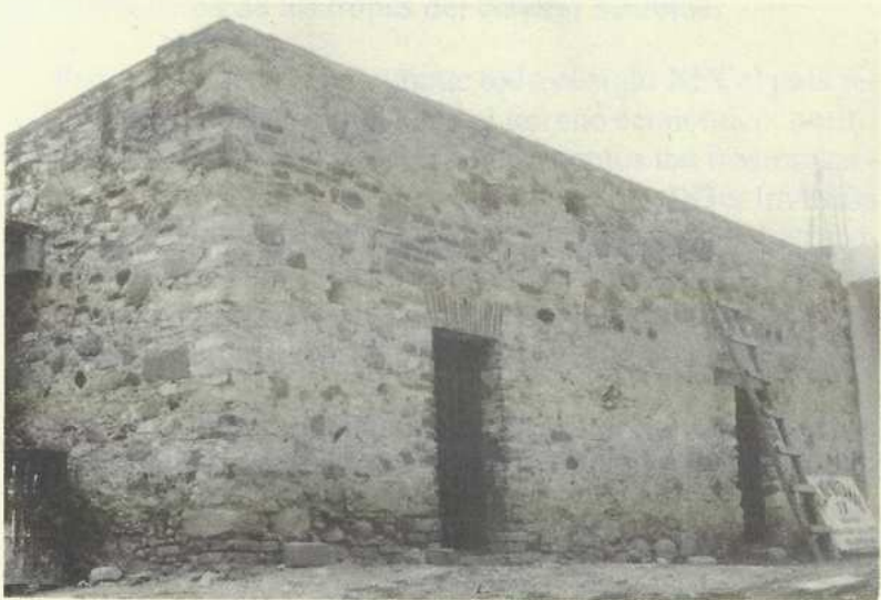
Cárcel Municipal de Magdalena Tetaltepec (2001)

Después de que Porfirio Díaz permaneció en la presidencia de la República más de 30 años (1876-1911, con excepción del periodo de 1887-1890, que nombró a Manuel González). Reeligiéndose a sí mismo y violando por lo tanto, la constitución de 1857, particularmente el principio de “No Reelección”. Dejó al país sumido en una fuerte crisis económica y política, siendo que: