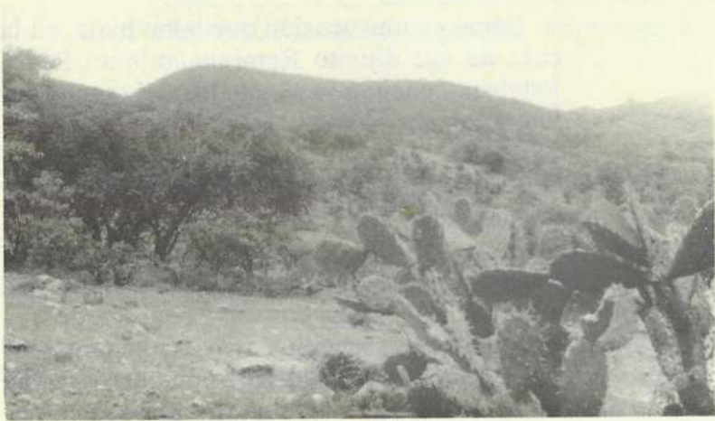
Cerro Yucundawi en Magdalena Tetaltepec (2001)