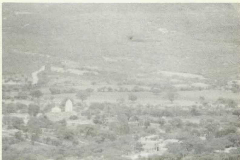
Terrenos Comunales de Magdalena Tetaltepec (2001)