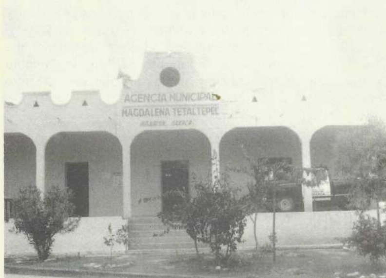
Agencia Municipal de Magdalena Tetaltepec, Huaj. Oax. (2001)

La confirmación de las tierras de Magdalena como Bienes Comunes, y propiedad comunal ha sentado las bases para el desarrollo de la comunidad. No es casual que esto ocurra, pues, la historia del pueblo ha estado íntimamente ligada a la lucha por la tierra desde su fundación, que fue realizada por campesinos jornaleros y peones de los caciques; hasta la época revolucionaria, que por el conflicto armado alejó a los campesinos de sus actividades agrícolas, hasta los años que comprende el periodo de los 30's a los 50's donde litigó con los pueblos circunvecinos provocó la bancarrota de Magdalena.