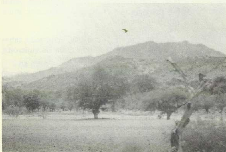
Cerro Pedregoso lugar del conflicto limítrofe (2001)

Corrían los años treinta cuando empezó un litigio con los pueblos vecinos – por cuestión de límites - San Miguel Ixtlán, Chila, El Rosario Micaltepec y San Miguel Ixtapan; siendo éste último el más rebelde, que patrocinado por Tequixtepec, causó muchos problemas a Magdalena, provocando en el año de 1947 un zafarrancho en el cerro Pedregoso, que arrojó como resultado dos muertos de San Miguel Ixtapan y el rompimiento de las relaciones de amistad: