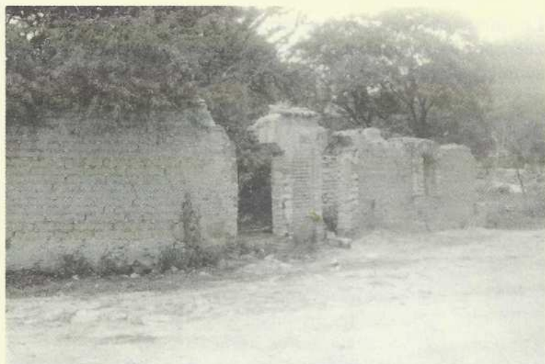
Vestigios de la casa de un terrateniente de Magdalena Tetaltepec (2001)

La crisis por la que atravesaba el pueblo, en gran medida, la gente se la achacaba a la presencia de soldados zapatistas, y ni qué decir de los ladrones. Porque mientras Emiliano Zapata luchaba contra los grandes terratenientes y hacendados – sobre todo en el Estado de Morelos, Puebla, Guerrero -, para devolverle las tierras a los campesinos indígenas; y por lo tanto contra el gobierno para que hiciera efectivo el “Plan de Ayala”, que en esencia reclama “Tierra y Libertad” para los campesinos pobres.