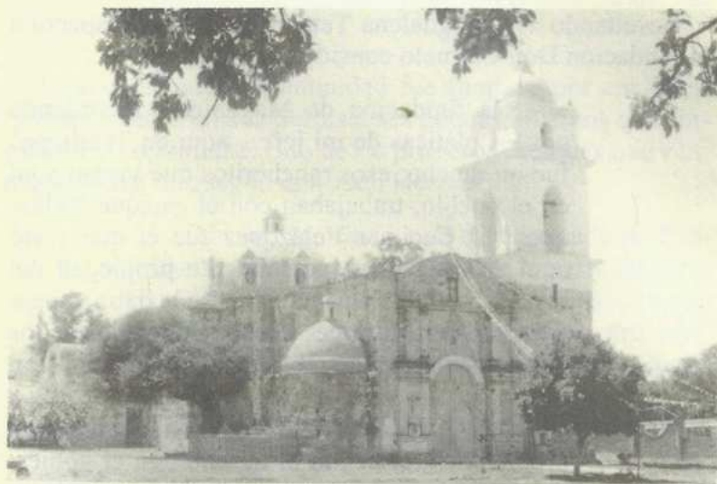
Iglesia Católica de Magdalena Tetaltepec, Construida en 1831. (2001)