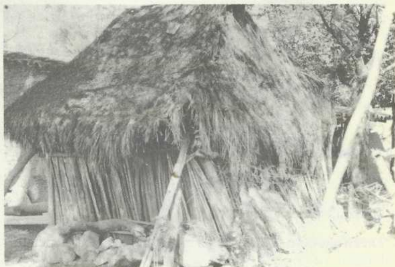
Vivienda de Palma de Magdalena Tetaltepec (1992)